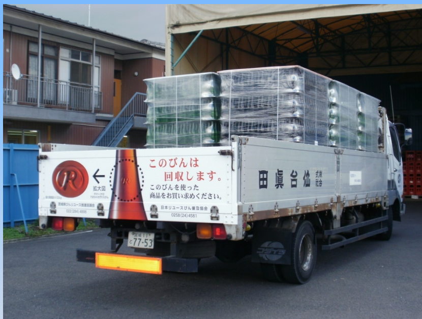
宮城県内・仙台市内の 回収や出荷に使用される トラック(3台)